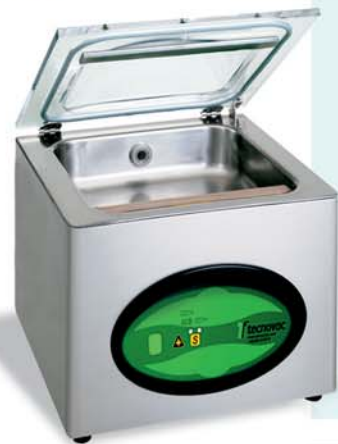
Table top vacuum packing machines for packaging in pouches for food products and non. They are compact and ergonomic and are made of stainless steel; these machines are easy to clean and long lasting. They are mainly used in supermarkets, butcher shops, delicatessens and restaurants.

Confezionatrici sottovuoto da banco per confezioni in busta per uso alimentare e non. Compatte ed ergonomiche, sono costruite in acciaio inox, di facile pulizia e grande durata. Vengono principalmente impiegate nei supermercati e vendite al dettaglio, macellerie e ristorazione.